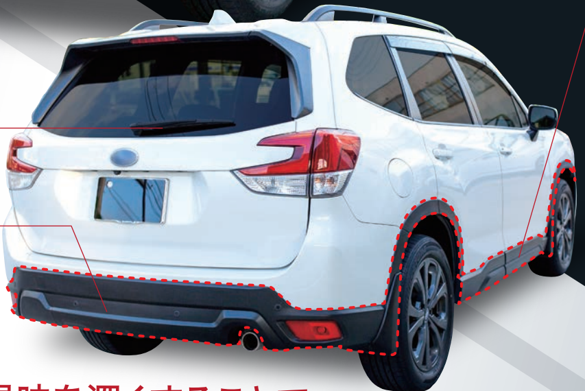
REAR WIPER リアワイパー