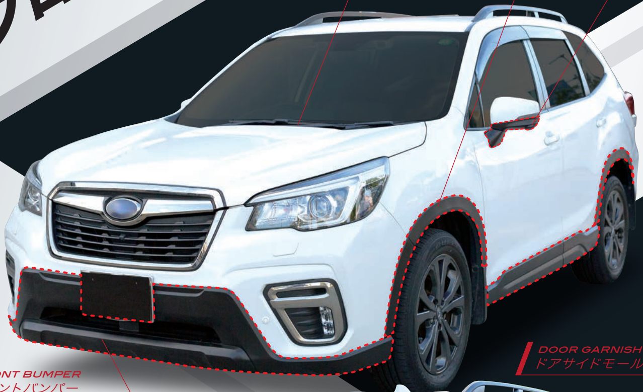
FRONT BUMPER フロントバンパー