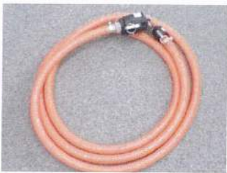
ホース5m(両端50A+25Aカプラ付き)