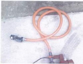
ホース5M先端25Aメスカプラ