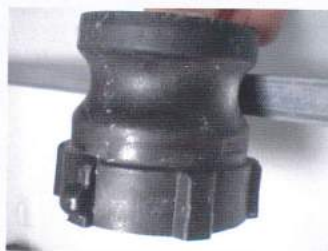
カムロックアダプター