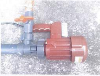
ハンディポンプ本体部HP-201型 100V