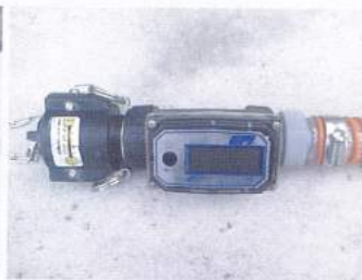
流量計(ニップル付き)